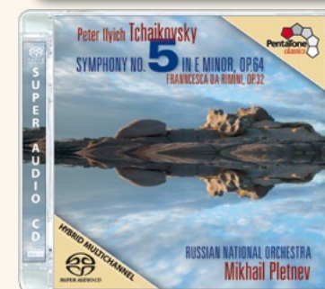
PTC 5186 385

Pour de plus amples informations, cliquez sur la jaquette.