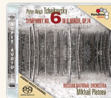
PTC 5186 386

En Russie, son statut a été officiellement reconnu en 1995, lorsqu'il a reçu le Premier prix national de la Fédération russe des mains du président Yeltsine. En 2002, le président Poutine lui a de nouveau remis ce prix honorifique.