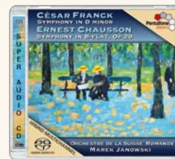
PTC 5186 078

Pour de plus amples informations, cliquez sur la jaquette.