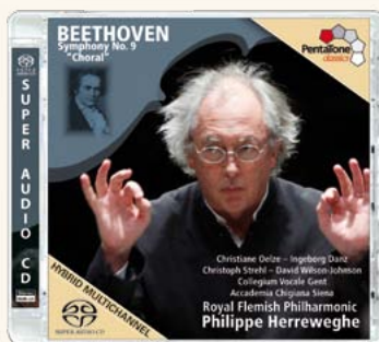
PTC 5186 317