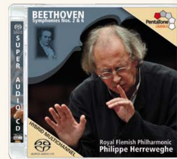
PTC 5186 314