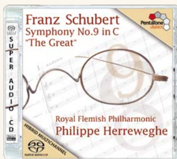
PTC 5186 372

En 1990, Philippe Herreweghe a été proclamé « personnalité musicale de l'année » pour sa vision artistique par la presse musicale européenne. En 1993, il a été nommé Ambassadeur culturel de Flandre avec le Collegium Vocale Gent. Un an plus tard, il a été nommé Officier dans l'Ordre des Arts et Lettres tandis qu'il devenait en 1997 docteur honoris causa à l'Université catholique de Louvain. En 2003, il a été fait Chevalier dans l'Ordre de la Légion d'Honneur.