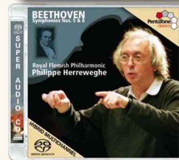
PTC 5186 316